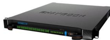
毅航iSX系列多媒体交换机