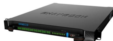
毅航iSX系列多媒体交换机